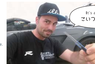
Danilo Crudele / Oscurazione Vetri Rome

NARROW BLADE KNIFE (SS-110) KAI Industries co.,Ltd Not for direct sale to out side Japan from manufacture. Contact to WRAP-TECH if you want. Made in Japan