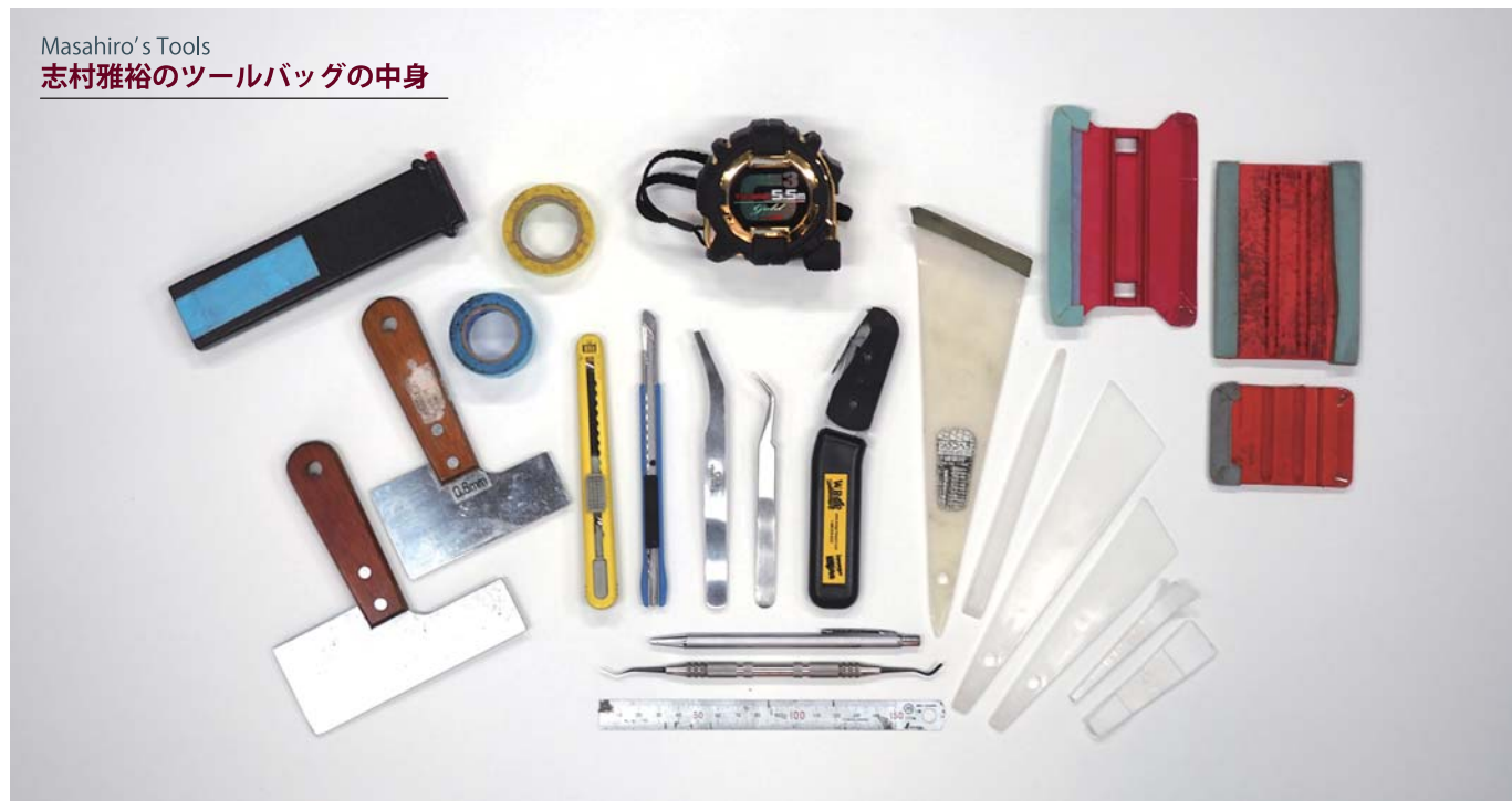
Masahiro's Tools 志村雅裕のツールバッグの中身

カッターナイフは施工に使う「目透かし」と材料の切り出しなどに使うカッターの2種類。それよりも重要なのがスキージー。一般的な面施工には「レッドウイング・スキージー」。細かい部分には様々なサイズのジラコヘラ。ヤスリで削ることができるので常にスムーズな施工ができるように先端をラウンドさせておくことができるほか、角度をつけておくことで様々なケースに対応できます。右ページの中本のツールと比較するとハードタイプの「白い」ジラコヘラのみを愛用しているのが面白い。